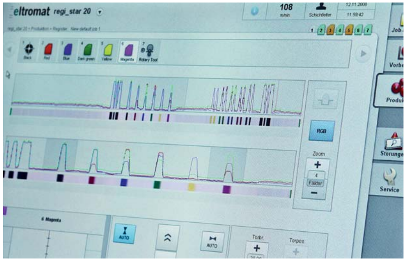
由于使用了 Beckhoff 的 XFC 技术，能够快速、精确地检测印标

能，Johann-Carsten Kipp 博士总结道：“当时，很多人都只是在谈论‘实时’以太网，但只有 Beckhoff 能够在实际上提供我们想要的一切。也即在 100 ns 范围内对分布式时钟进行同步。在谈及‘分布式时钟’—XFC 极速控制技术（eXtreme Fast Control）的一个组件—的运行模式时，Beckhoff 销售人员 Stefan Sieber 如此描述道：“如果是一个标准的离散控制回路，则会定期测量实际值，将结果传输到控制器中，对响应进行计算并将其结果传送到设定值输出单元并输出到过程中。对于多个控制过程来说，严格确定这一顺序就已经足够了。控制系统确定控制过程所需的速度。通常，在设计控制系统时会将控制器、控制系统、执行和测量单元中出现的死区相应地考虑进去，或者，可能进行死区补偿。这些程序是控制技术的基本原理，当然，也是多年的 TwinCAT 标准。对于套色控制来说，使用印标传感器检测过的印标必须与高精度印刷单元角度位置相匹配，从而才能够确定印标位置之间的差值。印标所需的时间精确度和印刷单元位置的检测由 I/O 组件中的高精度时钟实现。每个 EtherCAT 设备都有自己的本地时钟，它们通过 EtherCAT 相互之间不断进行同步。EtherCAT 设备相关的绝对时间差值得到了补偿，使得系统中的所有分布式时钟的最大偏差总是不超过 100 ns。”