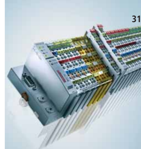
TwinSAFE : 安全技术直接集成到 I/O 系统中

Multivac, 是一家总部位于德国 Wolfertschwenden 的知名包装机械制造商, 在包装、产品及应用领域拥有着无与伦比的能力。Multivac 生产的热成型机被公认为是包装行业内全球最受欢迎的机械之一。同时, 公司也是托盘封口包装机和箱式包装机供应商, 提供各种顶级、独特的解决方案。在控制技术方面, Multivac 采用的是 Beckhoff 基于 PC 的控制技术。