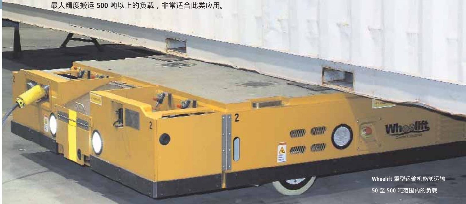
Wheelift 重型运输机能够运输 50 至 500 吨范围内的负载

随着全球能源、化工、建筑和航天航空等领域的蓬勃发展，制造商们需要制造的零部件也越来越大，因此需要相应的运输工具来不间断运输这些大、重型产品。由总部位于美国爱荷华州威佛里（Waverly）的 Doerfer 公司（TDS 自动化）生产的 Wheelift 重型运输机能够以最大精度搬运 500 吨以上的负载，非常适合此类应用。