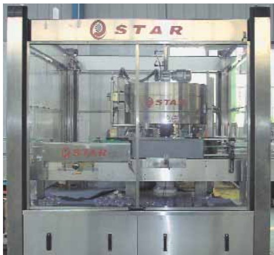
科时敏热熔胶贴标机产能高达每小时 24,000 到 48,000 瓶

控制上需要解决的主要问题是: 在高速条件下, 实时检测标签长度, 调整送标速度, 确保正确的切刀位置。采用 TwinCAT NC, 我们可以精确记录色标位置, 并通过高速工业以太网 EtherCAT 将此位置数据传送给控制器 CX1020, CX1020 计算出标签长度, 并修改 CAM 曲线。调整伺服电机送标速度, 实现准确送标。我们可将最终的送标精度控制在 0.01 mm 以内, 避免送标累计误差的出现。