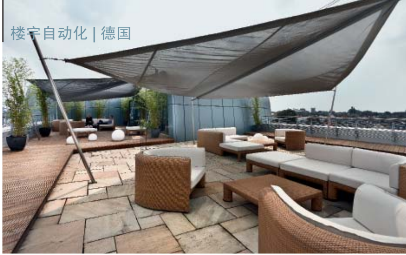
屋顶露台上的遮阳篷用一台伺服电机将其两端升高和降低