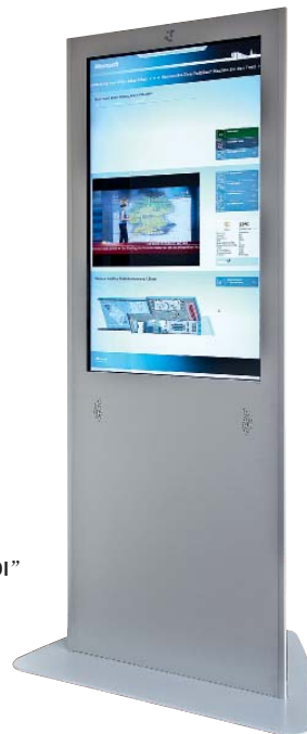
用作信息与控制中心的“POI”自助信息终端