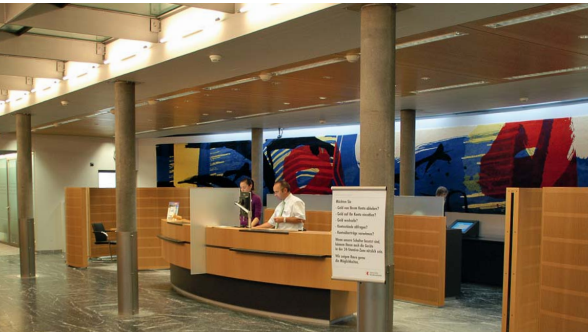
Appenzeller 州立银行客户服务区