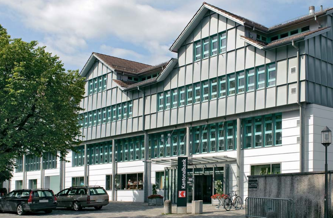
Appenzeller 州立银行在 Appenzell 的总部办公大楼。扩建部分（左后）将该栋大楼划分为 3 个在建筑上相当的部分，同时对现有大楼进行了大范围的改建