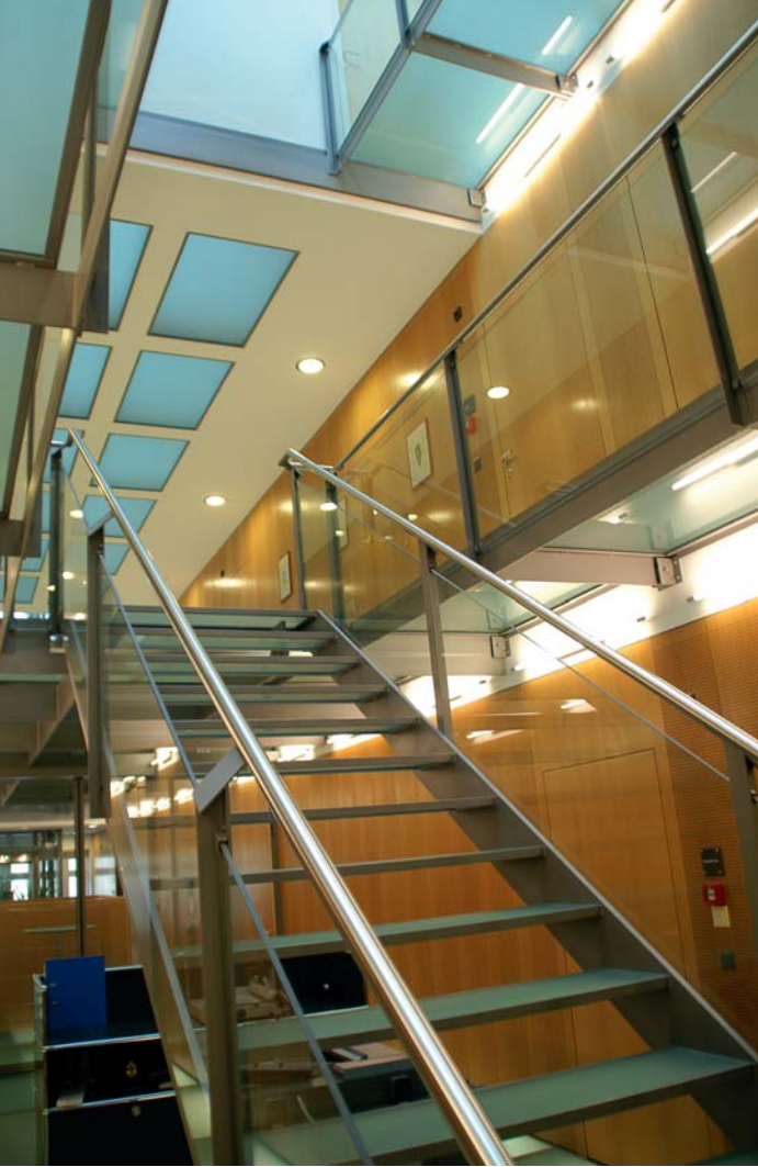
日光充足的中庭用作内部交流区