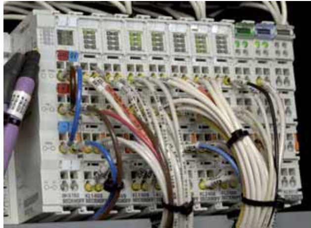
AIM 将 Beckhoff 总线端子模块 I/O 集成在 AGC 上，并分布在 CP7202 操作员站附近