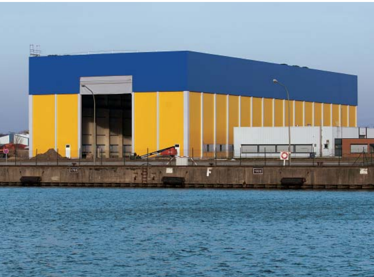
德国不来梅港的生产车间直接坐落于港口，方便船只运输

海上风电场运行的重要要求就是机舱的密封性：空气处理系统从环境空气中分离出盐和水粒子，在机舱内生成正压，避免具有侵蚀性的海洋大气进入，保护易受损的控制元件受到侵蚀。