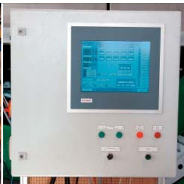
M5000 试验台主要用于减少功能试验和调试时间，优化操作步骤和控制过程