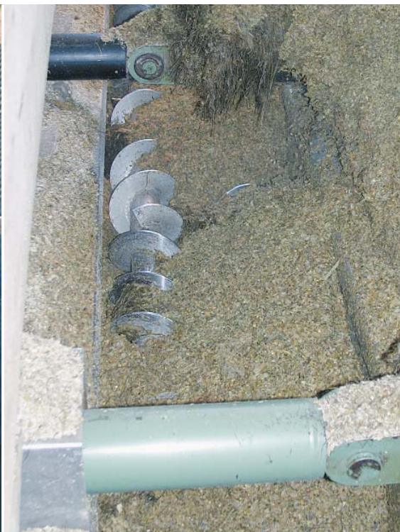
螺旋进料器将沼气运输到发酵池中

来自德国罗森菲尔德的 BSAutomatisierung GmbH 可为机器制造领域中的加工和装配设备以及可再生能源行业中的设备提供完整的自动化解决方案。他们为德国的盖斯林根（Geislingen）的 Bio-Energie Heuberg GmbH & Co. KG 营业公司安装了一个沼气厂，采用的是 Beckhoff 自动化技术。 Beckhoff 自动化技术的主要应用于机器和工厂自动化的高科技应用领域。然而， Beckhoff 具有广泛的适用性，一些较简单的任务，如沼气厂的控制，实施起来毫不费力。