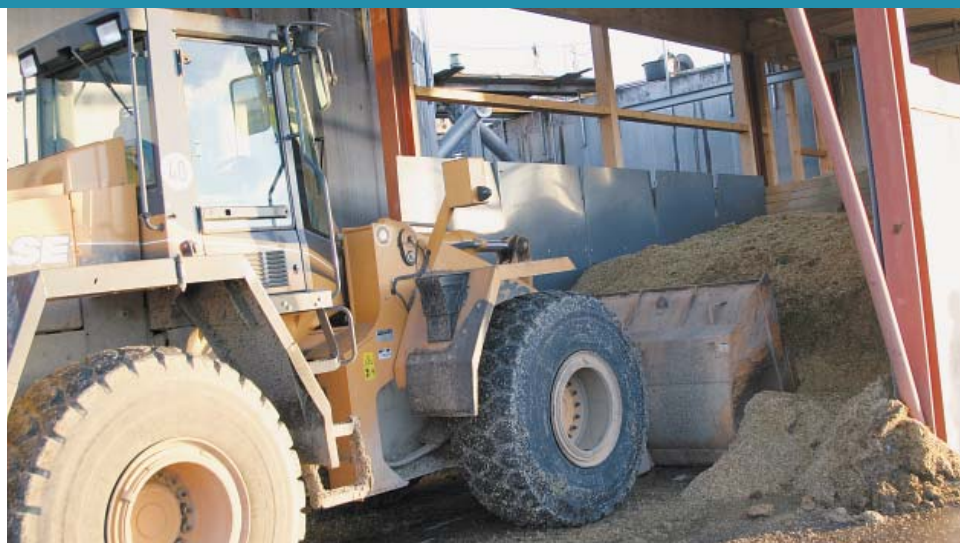
沼气厂可输出 500 kW 的电量。它利用生物能（如玉米穗青贮或液态肥）作为燃料供电。

来自德国罗森菲尔德的 BSAutomatisierung GmbH 可为机器制造领域中的加工和装配设备以及可再生能源行业中的设备提供完整的自动化解决方案。他们为德国的盖斯林根（Geislingen）的 Bio-Energie Heuberg GmbH & Co. KG 营业公司安装了一个沼气厂，采用的是 Beckhoff 自动化技术。 Beckhoff 自动化技术的主要应用于机器和工厂自动化的高科技应用领域。然而， Beckhoff 具有广泛的适用性，一些较简单的任务，如沼气厂的控制，实施起来毫不费力。